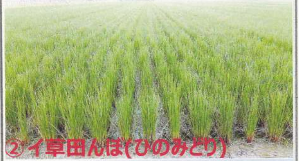
②イ草田んぼ(ひのみどり)