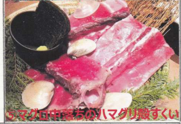
⑤マグロ中落ちのハマグリ殻すくい

◎ヒラズミ情報 ○男前表クレーム(図④) 4月19日に男前表に麻糸の糸 フケのクレームをいただき、 直ちに代品をお送りしました。 今後、逆光向きの麻糸も実施 し、品質向上を図ります。 ○マグロ中落ちのハマグリ殻 すくい(図⑤) 詳しくはFB