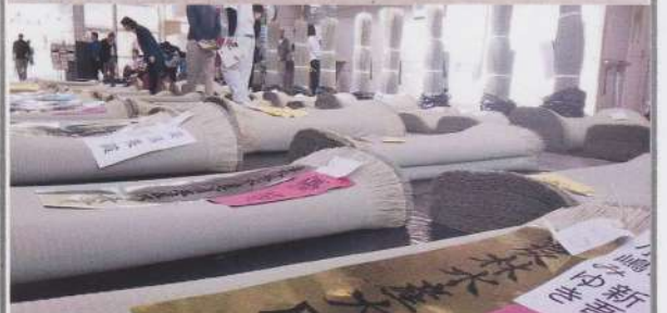
⑤ 品評会入賞品の展示(昨年画像)