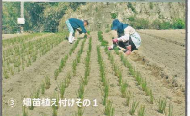
③ 稲苗植え付けその1