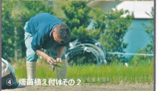
④ 稲苗植え付けその2