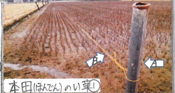
本田(ほんどん)のい草①