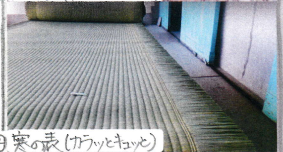
④寒の表 (カラッとキュッと)