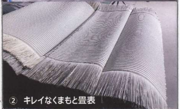
② キレイなくまもと畳表

朝晩が涼しくなり、湿度が低下して至F。絶好の製織環境となり、キレイな畳表(本間麻糸入り表、五八市広表など)が続々入荷中。