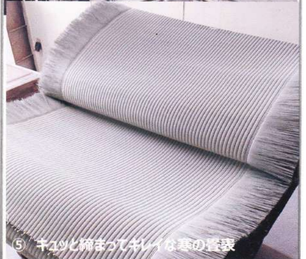
⑤ キレイと縮まってキレイな寒の表

Q.写真③ 本田写真の 白丸内の 黄色い ヒモは、 何の目的で 田んぼの土を 100m張っているのをおか?